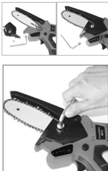
Pic. 2 / Výkres / Kreslenie / Obrazek / Рисуване / Desen / Кép / Рис. / Мал.